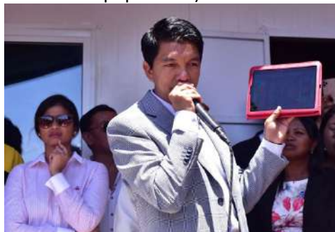
Le Président Rajoelina visite une école

À Madagascar, pour la première fois depuis plus de 50 ans, les élections (présidentielles, législatives et communales) se sont déroulées sans incidents majeurs. Cela devrait, à terme, aider la croissance économique, mais le taux de pauvreté est toujours aussi fort (estimé à 75% de la population).