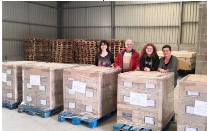
Les 5 palettes de livres vont quitter Bar-le-Duc

* Fédération des conseils de parents d'élèves