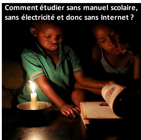
Comment étudier sans manuel scolaire, sans électricité et donc sans Internet ?