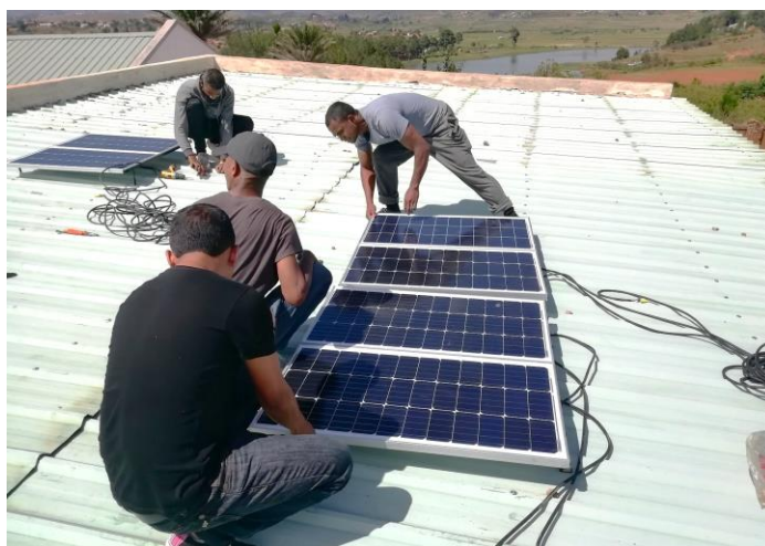
Nos techniciens installant des panneaux solaires

Pour faire face aux besoins immédiats, il nous faudrait 500 ordinateurs à répartir dans l'ensemble de nos établissements partenaires afin de renouveler les équipements obsolètes et atteindre le nombre minimum d'ordinateurs adapté à chaque établissement.