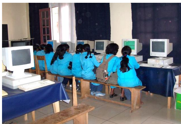
Équipements obsolètes dans une salle médiathèque

Alternativement, une solution plus "classique", installée dans 7 lycées, consiste à utiliser un ou plusieurs ordinateurs portables, alimentés par système "photovoltaïque". Pour des classes peu chargées (environ 30 élèves), on peut envisager de ne mettre qu'un ou deux ordinateurs portables dont l'un relié à un vidéoprojecteur, et une imprimante. Le prix global de l'installation, de la formation et de l'accompagnement est alors de 5700€, soit une dépense de 190€ par élève .